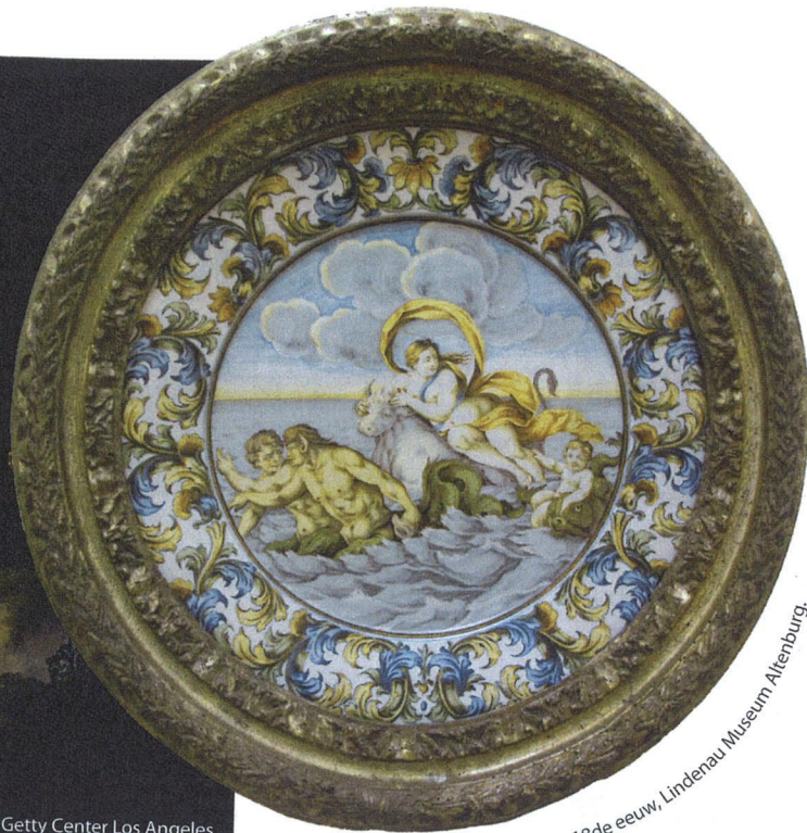
18de eeuw, Lindenau Museum Altenburg.

het avondland! Europa bezat alles wat Rusland niet kende: een zacht klimaat, een 'heerlijke plantengroei', een vrije, dynamische bevolking. Om dit bevoorrechte deel van de wereld te beschermen dienden de landen van Europa onmiddellijk tot samenwerken over te gaan. Als vakbondsman legde Serrarens de nadruk op de noodzaak, allereerst, van het aanleggen van een stevig sociaal fundament, te beginnen met het opstellen van een Europees wetboek van sociale zekerheid. Europa zou zo tegemoet kunnen komen aan de wensen van de arbeidersklasse en het 'goddeloze communisme' kunnen weerstaan.