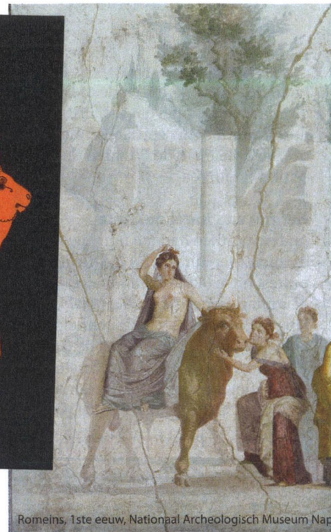
Romeins, 1ste eeuw, Nationaal Archeologisch Museum Nap

die van die verdeling het gevolg was, heeft Verdun in de oorlog 1914/1918 gemerkt. Het is onze taak te trachten de verdeeldheid (...) te doen opheffen.' Bruins Slot ging ook in op de vrees van veel landgenoten voor soevereiniteits-overdracht aan een verenigd Europa. Hij dacht dat die een historisch gegeven was. De Nederlandse geschiedenis was immers vanaf de Middeleeuwen 'één proces van soevereiniteitsoverdrachten' geweest. Toen waren eerst Bourgondische hertogen de baas geweest, daarna de Habsburgers en vervolgens ontstonden de Nederlanden als onafhankelijke staat. Geen vuiltje aan de lucht dus, niets nieuws onder de zon, al liet Bruins Slot ook weten dat te snelle integratie nooit goed kon zijn.