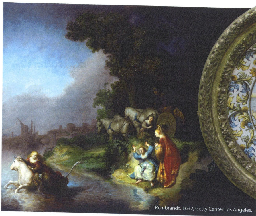
Rembrandt, 1632, Getty Center Los Angeles.