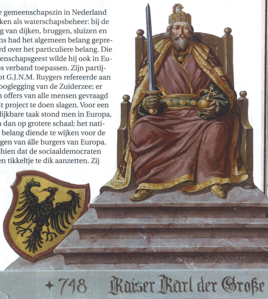
Muurschildering van keizer Karel de Grote op het raadhuis van Lauterhofen, Duitsland.

sterke gemeenschapszin in Nederland bij zaken als waterschapsbeheer: bij de aanleg van dijken, bruggen, sluisen en molens had het algemeen belang geprevaleerd over het particuliere belang. Die gemeenschapsgeest wilde hij ook in Europees verband toepassen. Zijn partijgenoot G.J.N.M. Ruygers refereerde aan de drooglegging van de Zuiderzee; er waren offers van alle mensen gevraagd om dit project te doen slagen. Voor een vergelijkbare taak stond men in Europa, alleen dan op grotere schaal: het nationale belang diende te wijken voor de belangen van alle burgers van Europa. Misschien dat de sociaaldemocraten het een tikkeltje te dik aanzetten. Zij